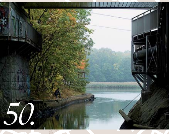
NORRSTRA ÖSTBY ÖLÖ